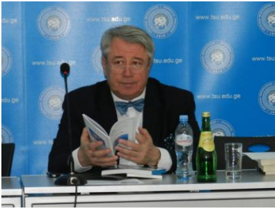
სკოლა-კონფერენციის საორგანიზაციო კომიტეტის წევრი