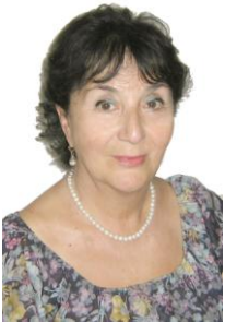
სკოლა-კონფერენციის საორგანიზაციო კომიტეტის წევრი

მედიკოსთა ტრადიციული სკოლა-კონფერენციების საორგანიზაციო კომიტეტის წევრი 2004 წლიდან. მისი ხელმძღვანელობით ტარდება ლექციები, დისკუსიები, მრგვალი მაგიდები, საინტერესო შეხვედრები და კულტურულ-გასართობი ღონისძიებები